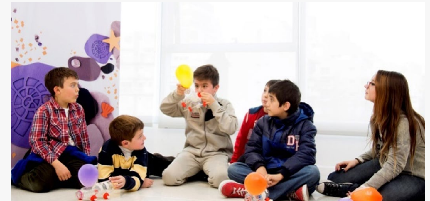
Taller en el Centro Cultural de la Ciencia