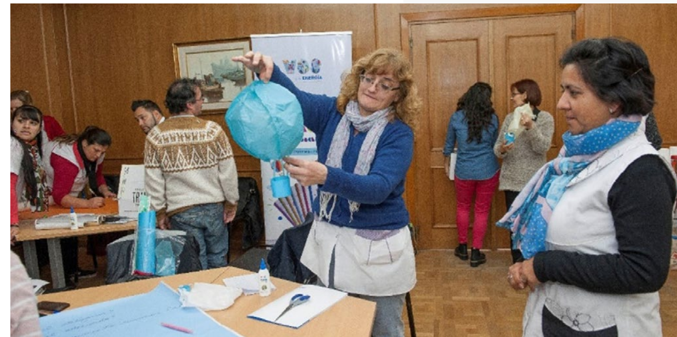
Taller de formación Docente "Vos y la Energía Primaria" Buenos Aires 2018