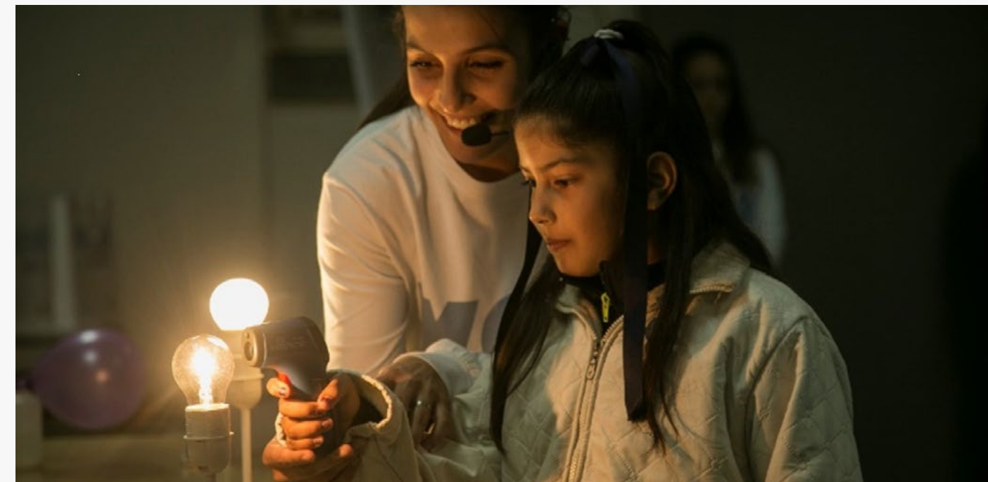
Feria EDUCATEC de Niños- TUCUMAN